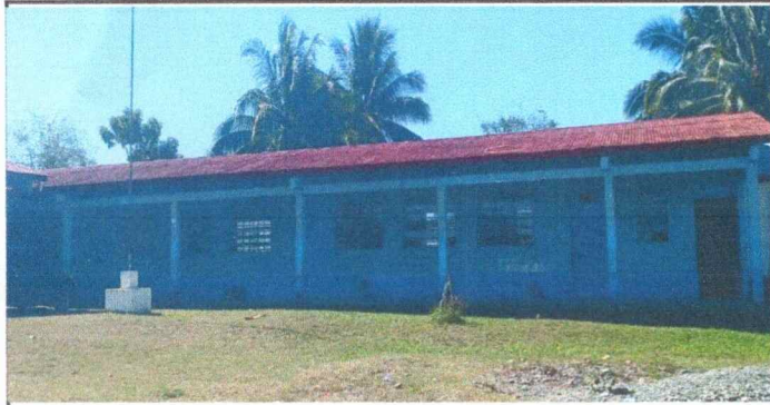
Foto 1: MÓDULO 1. Se observa el deterioro y la necesidad del cambio total de las láminas.