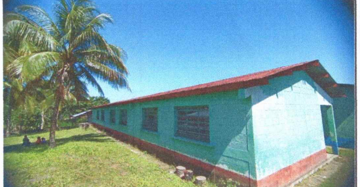
Foto 2: Módulo 1. Se observa la necesidad del mantenimiento de estructuras metálicas.