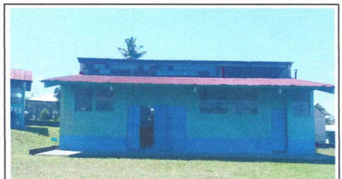
Foto 4: MÓDULO 2. Se observa el deterioro y la necesidad de cambio de láminas y mantenimiento de estructuras metálicas del aula de preprimaria