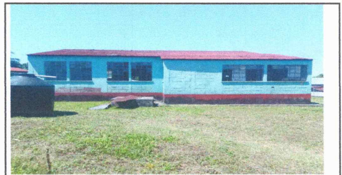
Foto 6: Módulo 2. Se observa la necesidad de pinturas en las paredes exteriores e interiores de las aulas.

Observación: Si es necesario se pueden agregar hojas adicionales y actualizar el número de hojas.